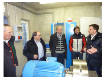
Wundschuh, März 2011